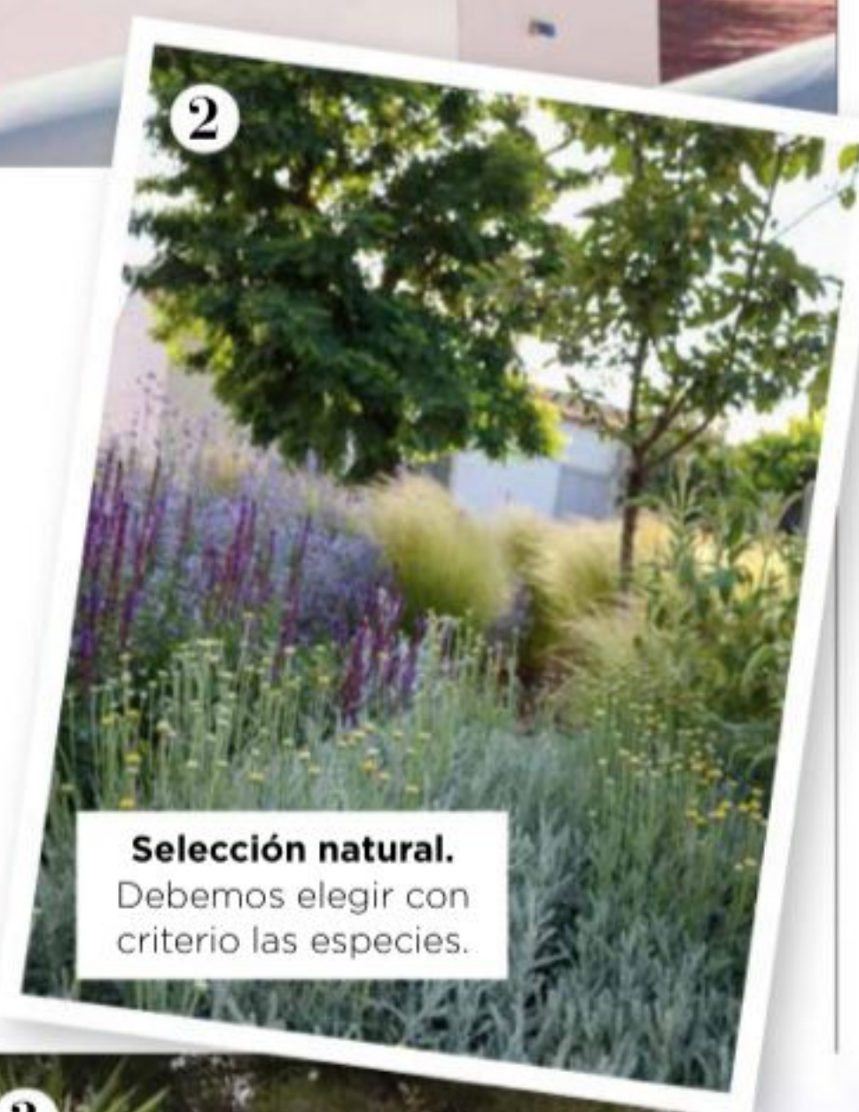
2 Selección natural. Debemos elegir con criterio las especies.