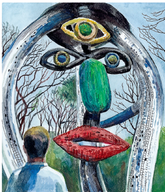
IZDA., JARDÍN DEL TAROT, EN CARAVICCHIO (ITALIA). DCHA., CASA DEL MEXICANO JUAN O'GORMAN. ABAJO, 'EL PASATIEMPO' (ENCYCLOPAEDIA BOTANICA).

Y también está César Manrique, cuyo mérito fue ver el color sobre las cenizas volcánicas de Lanzarote. Sobre lo que un día fue magma, Manrique creó un insólito universo de basalto, cal y vegetación, ligado para siempre al porvenir de su isla natal. La Quinta da Regaleira (Portugal), Las Pozas de Edward James (México), el castillo daliniano de Púbol en Cataluña, o el de William Randolph Hearst en California son otros de estos poliédricos paraísos terrenales. Lugares más ligados a la imaginación de sus creadores que a la realidad mundana.