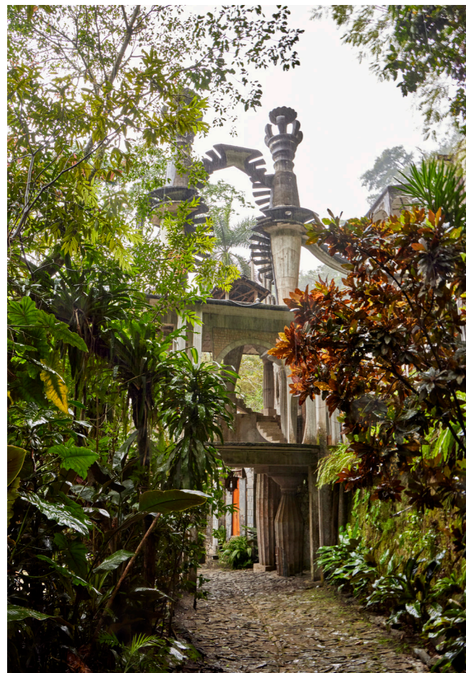
↑ La Escalera al Cielo corona el Cinematógrafo, la primera de las 27 estructuras de hormigón que se construyeron en el jardín.