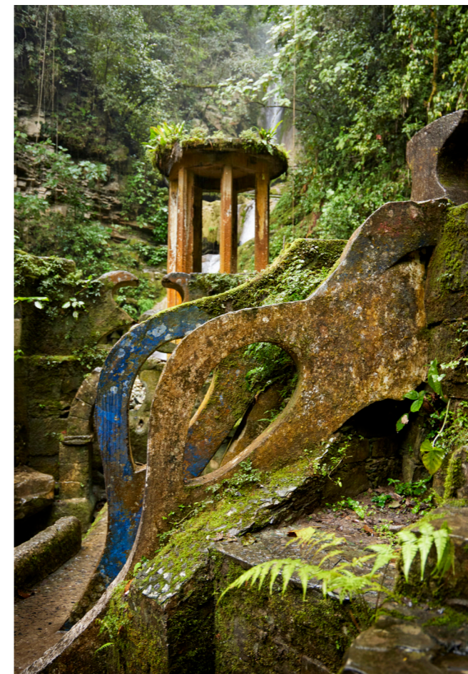
← Las Pozas es una oda al surrealismo inmersa en un ambiente entre gótico, romántico y exótico que rezuma humedad.